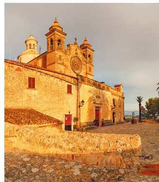
Bij een laagstaande avondzon lijkt het Santuari de Bonany te gloeien dankzij de okertinten van de stenen

... zo noemen de locals deze bedevaartskerk, die officieel Santuari de Bonany (🗺 G 5) heet. Door de ligging op de top van een beboste berg is de kerk al van verre zichtbaar. Hier wordt een Mariabeeld vereerd dat in 1609 een einde gemaakt zou hebben aan een dreigende droogte. De akkers waren dor, de oogst leek te mislukken. Nadat de inwoners in processie naar een kapel