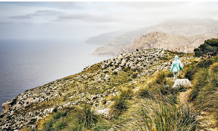
De wandeling van Sant Elm naar La Trapa doorkruist een kustlandschap met kale rotsen en hier en daar een struik