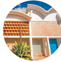
Een grapje van de architect? Het dak van de Taller Sert heeft de vorm van de letter 'M' (van Miró)

1956 een klein huis, omgeven door een enorme tuin. Tot zijn dood in 1983 zou de Catalaanse kunstenaar, die vooral bekend werd door zijn surrealistische werken vol kleur en symboliek, op Mallorca blijven wonen. In het testament van de kunstenaar en zijn vrouw werd het terrein overgedragen aan een stichting, die hier nu werken van Miró presenteert.