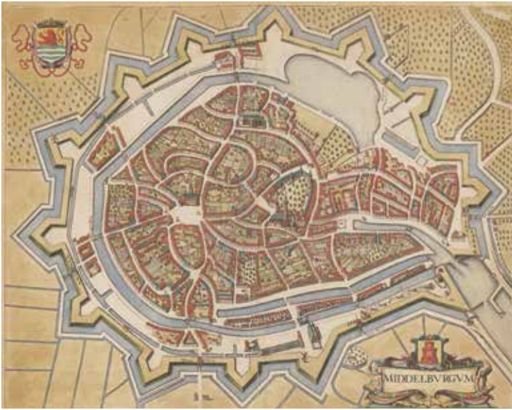
2 JOHANNES JANSSONIUS, PLATTEGROND VAN MIDDELBURG, 1657