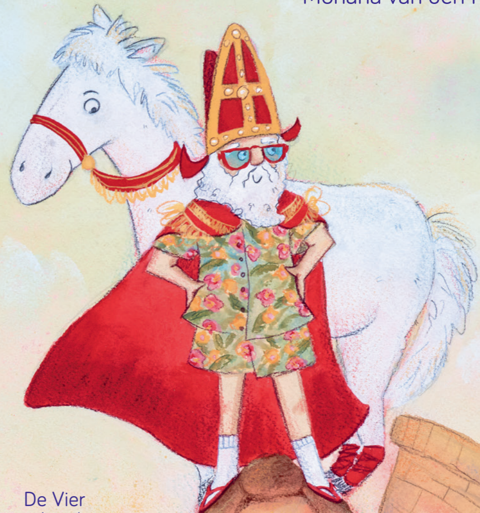
De Vier Windstreken