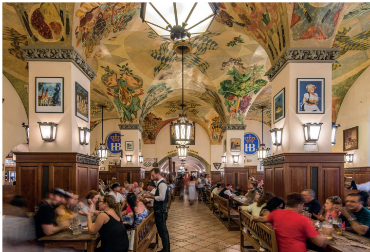
Het Hofbräuhaus is een van Münchens bekendste café-restaurants.

dan 3500 gasten kunnen er tegelijkertijd terecht. Politici van alle gezindten vonden hier de geschikte ruimte om hun meetings te houden. Zo ook een zekere Adolf Hitler, die hier in 1920 het programma van zijn latere partij, de NSDAP ( Nationalsozialistische Deutsche Arbeiterpartei ) liet goedkeuren.