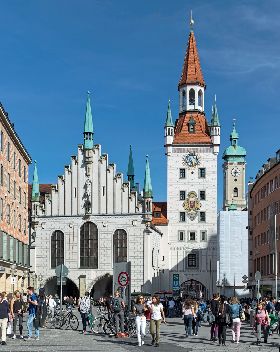
In de toren van het Altes Rathaus is nu het speelgoedmuseum gevestigd.