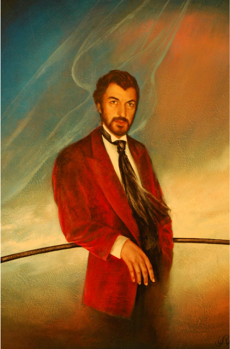
Maître de l'Ombre, Gilbert Retsin Privécollectie – Lucifernum