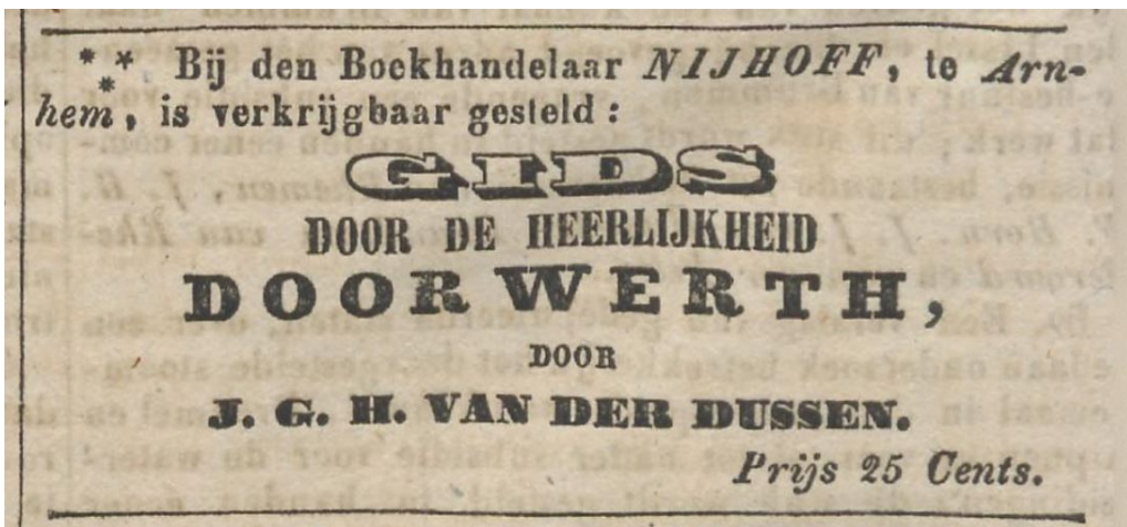
1 Advertentie in de Arnhemse Courant, 10 juli 1840.